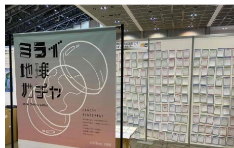
回答用紙の展示例