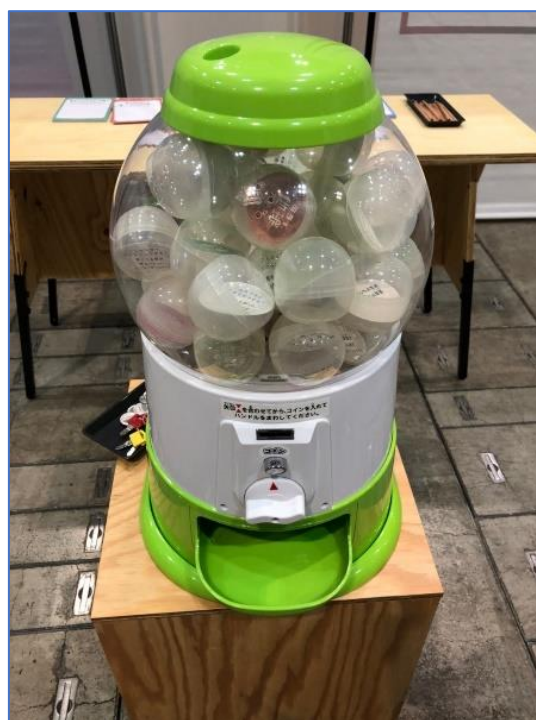
ガチャ全体図（コイン式）