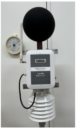
図1 電子式AWBGT指数計 (TC-891-X-54、鶴賀電機)

WBGT (Wet Bulb Globe Temperature: 湿球黒球温度)は湿球温度、黒球温度、乾球温度を用いて、式(1)から算出されるが、ISO (ISO 7243:2017)とJIS (JIS Z8504:2021)の規格では、湿球温度の計測に濡れたガーゼに包まれた温度計(以降、「自然湿球計」)を必要とするが、市販されている電子式WBGT指数計(図1)の多くで自然湿球計の代わりに湿度センサーが使用されており、演算にて湿球温度を算出している(JIS B7922:2023)。