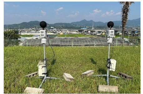
図2 並行試験の様子 (上:アスファルト、下:露場)

(地点)①アスファルト(設置高1.5m) 7月上旬、②露場(設置高1.5m) 8月上旬、③室内(設置高1.5m) 9月上旬