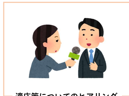
適応策についてのヒアリング