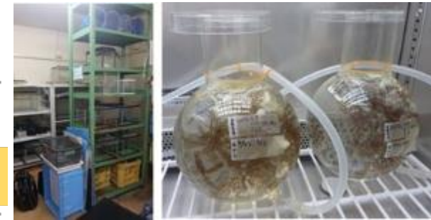
(左:飼育実験室/右:飼育実験イメージ)