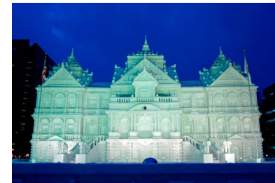
さっぽろ雪まつりの雪像