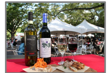
さっぽろオータムフェストの写真